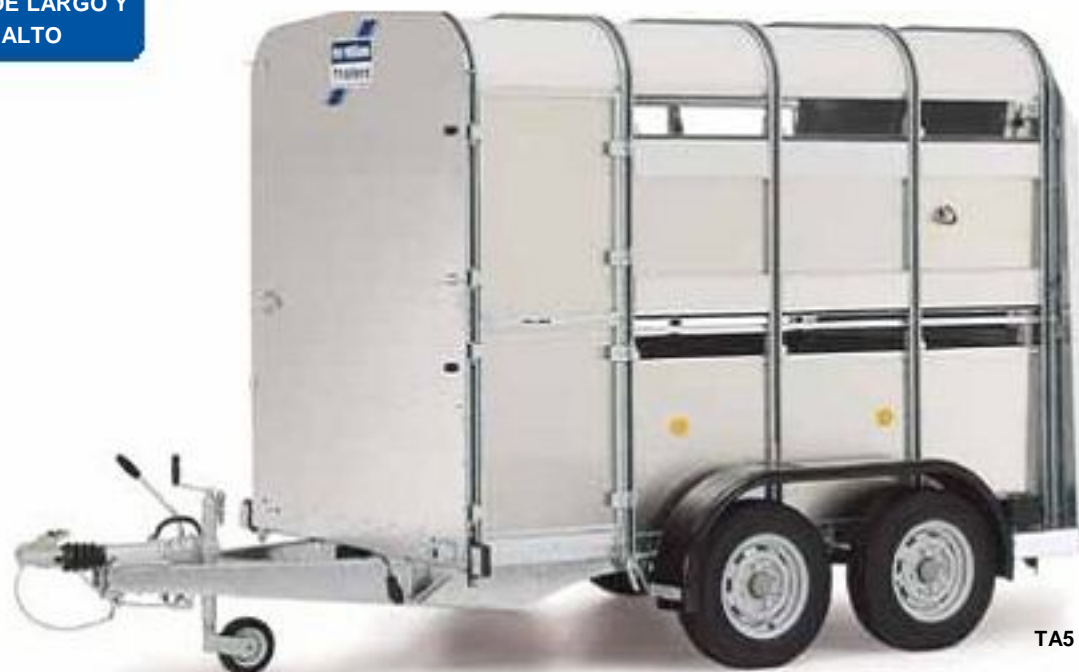
TA5 8' (6' altura)

DISPONIBLE EN 8', 10', 12' DE LARGO Y 6', 7' DE ALTO