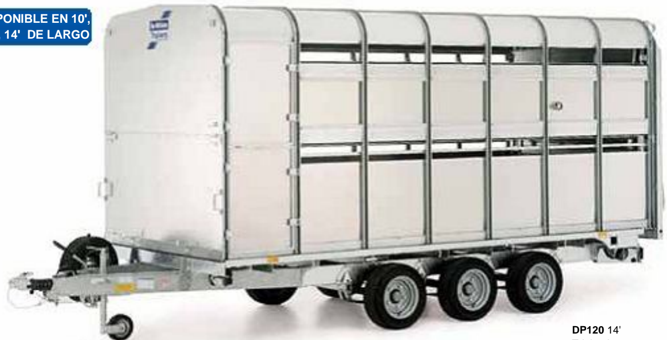
DP120 14' Triple eje