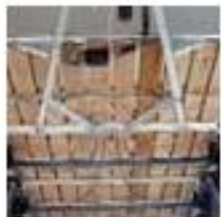
Chasis y suelo

Es la atención al detalle de Ifor Williams lo que hace que nuestros productos sean tan populares entre los propietarios. Échele un vistazo a estas características estándar.