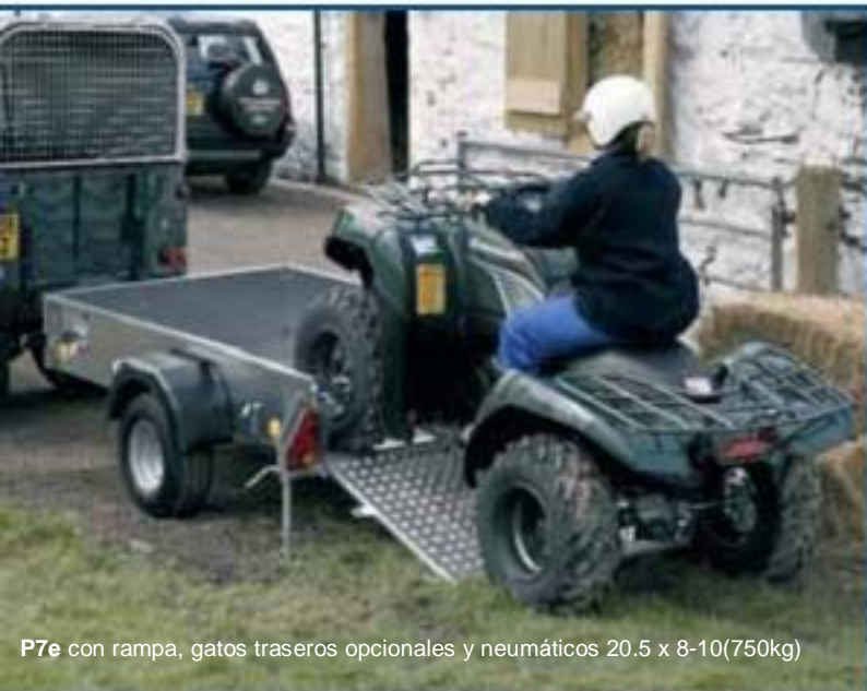
P7e con rampa, gatos traseros opcionales y neumáticos 20.5 x 8-10(750kg)