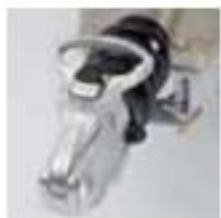
Cabezal de enganche