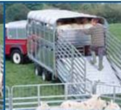
Cerrando puerta superior.