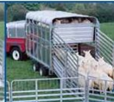
EasyLoad™ ha sido bajada y se está cargando el piso de abajo.

Los modelos mostrados encima pueden incluir opcionalmente extensiones laterales de portillas y pequeñas divisiones.