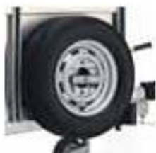
Rueda de repuesto