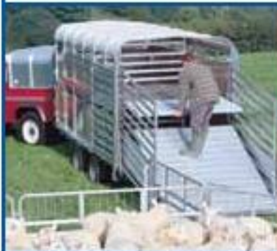
EasyLoad™ desplegada y puerta trasera en posición de carga.

DP120 12' es el modelo mostrado, con divisiones opcionales.