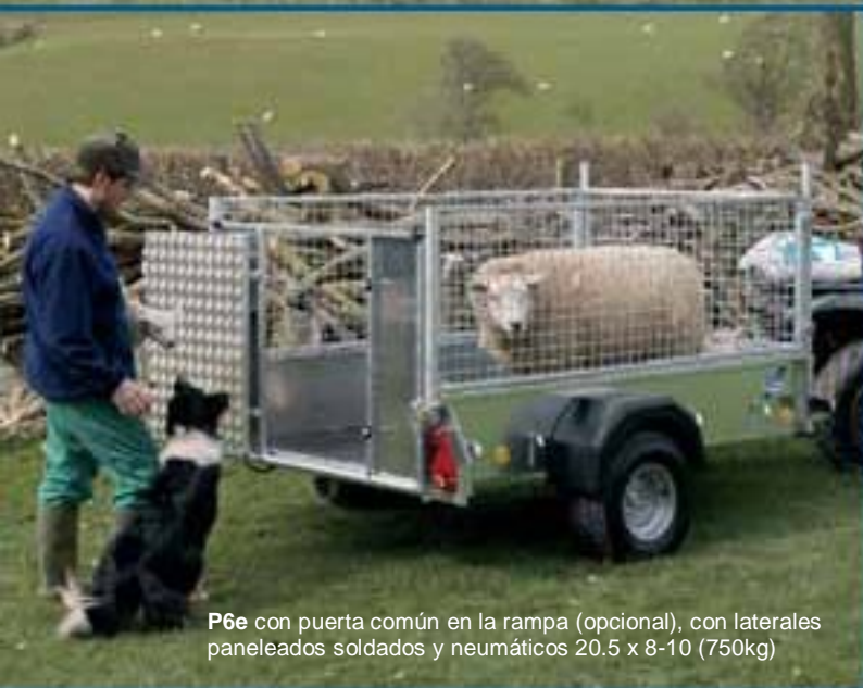
P6e con puerta común en la rampa (opcional), con laterales paneados soldados y neumáticos 20.5 x 8-10 (750kg)

Nuestra gama completa de remolques P6e y P7e se pueden encontrar en nuestro folleto de remolques sin freno, disponible en tu distribuidor.