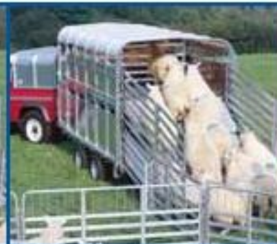
Cargando el piso de arriba.