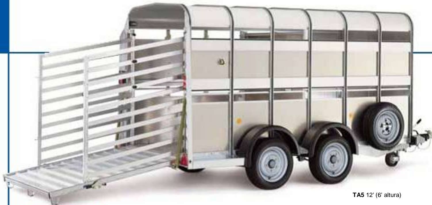
TA5 12' (6' altura)

DISPONIBLE EN 8', 10', 12' DE LARGO Y 6', 7' DE ALTO