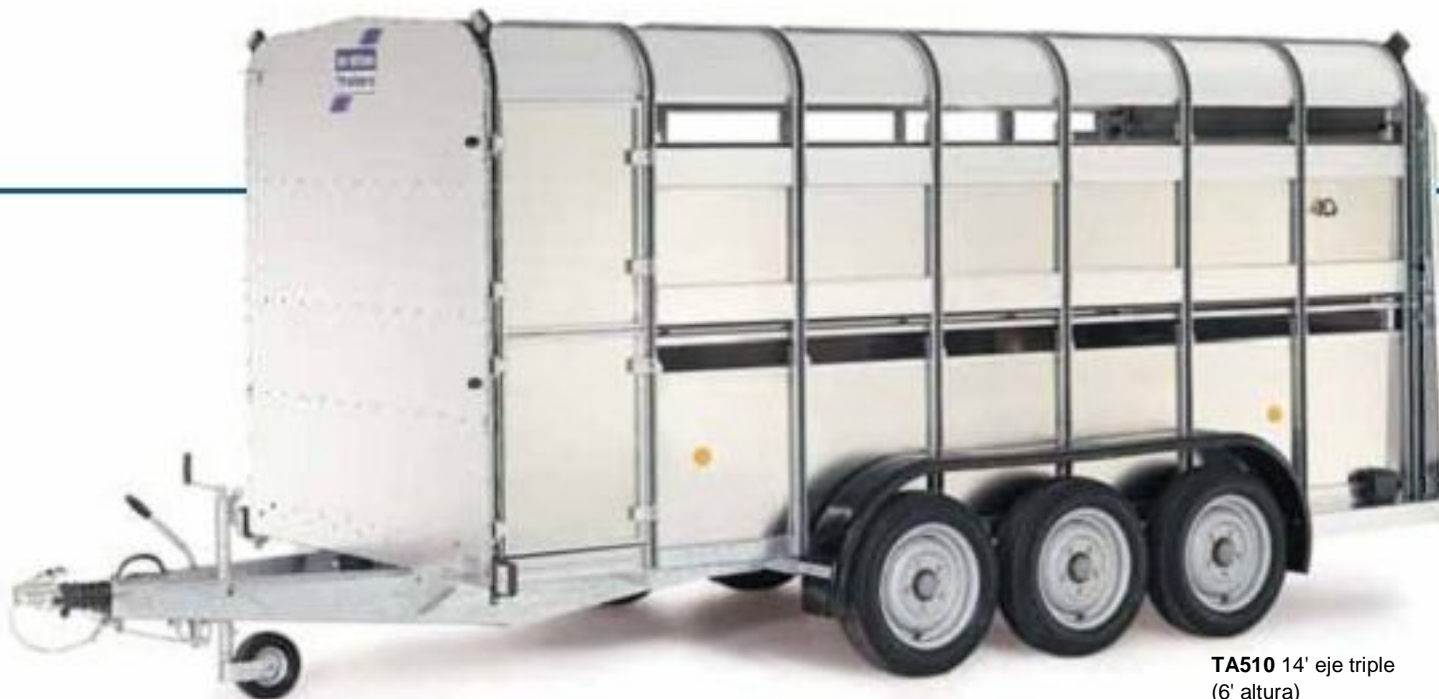
TA510 14' eje triple (6' altura)

DISPONIBLE EN 10', 12', 14' DE LARGO Y 6', 7' DE ALTO