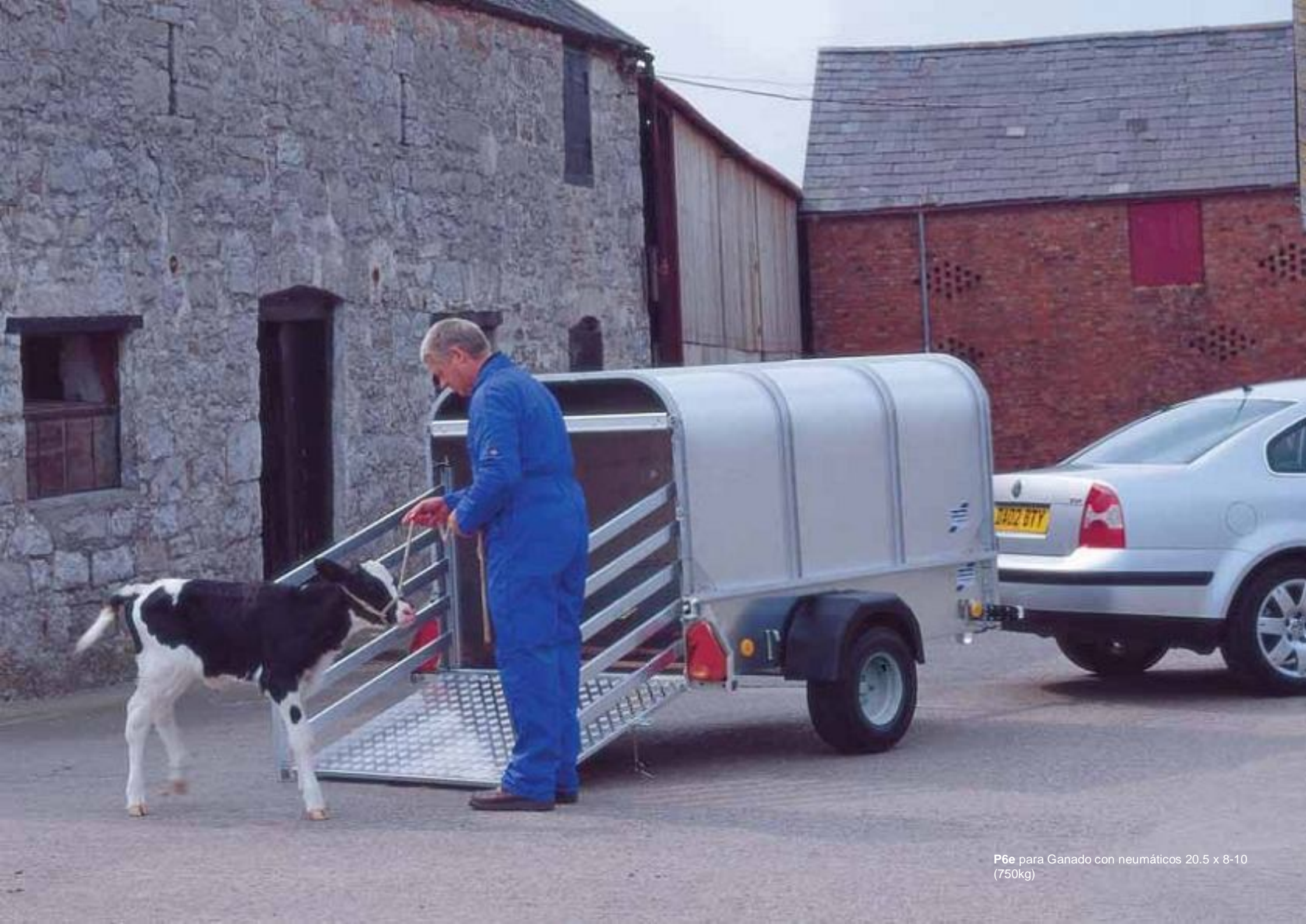
P6e para Ganado con neumáticos 20.5 x 8-10 (750kg)