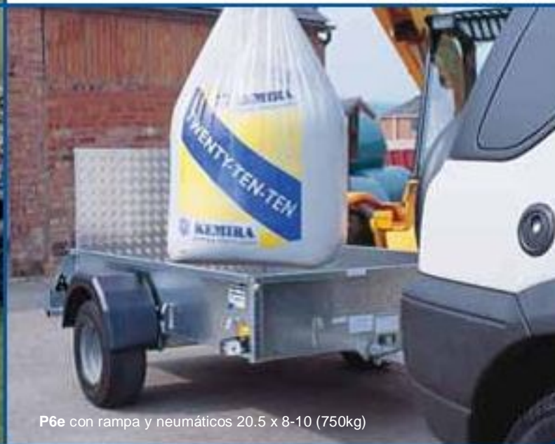
P6e con rampa y neumáticos 20.5 x 8-10 (750kg)