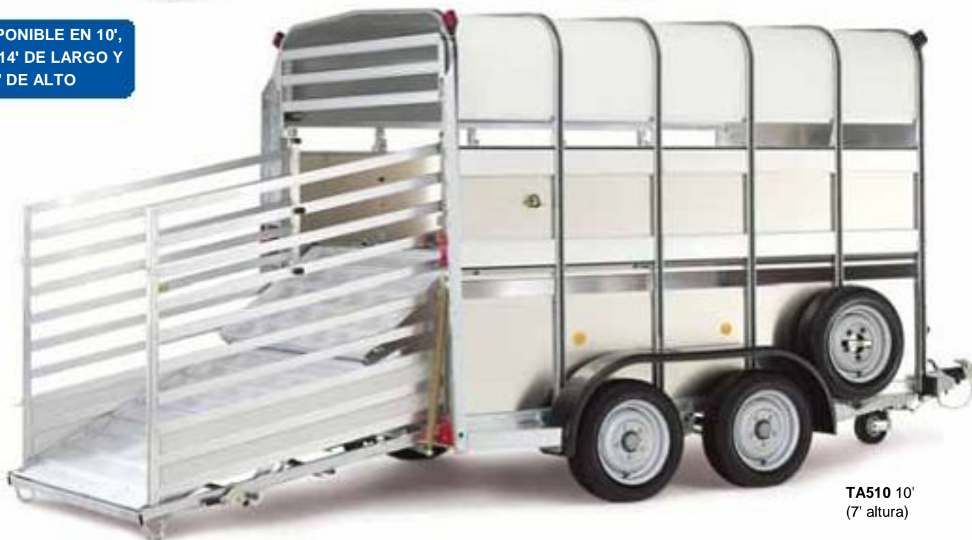
TA510 10' (7' altura)

DISPONIBLE EN 10', 12', 14' DE LARGO Y 6', 7' DE ALTO