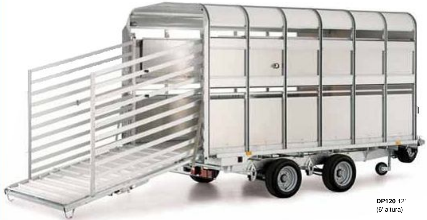
DP120 12' (6' altura)